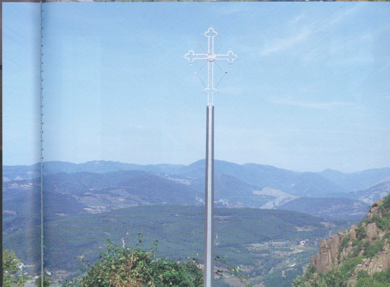
La rivière Idrî sort de frontière entre la partie serbe et la partie kosovare de la ville. Une passerelle pour piétons reliant les deux rives a été construite en 2008. La photographie qui montre la plaque posée lors de son inauguration date de 2009, celle du bus de 2010. Page de droite, les montagnes au nord de Mitroviça en allant vers la Serbie.