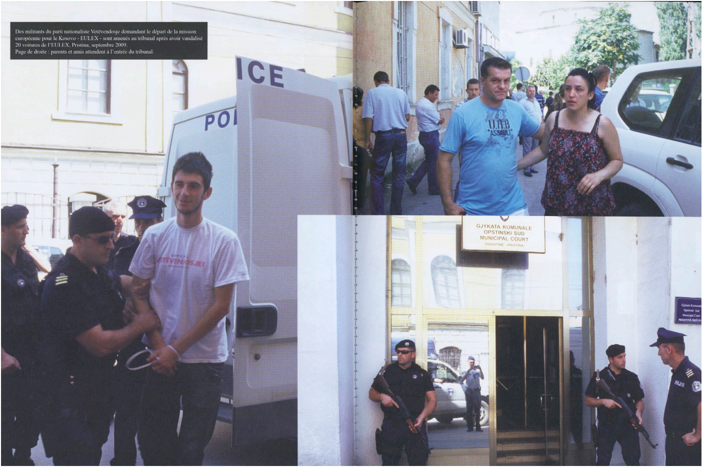
Des militants du parti nationaliste Vetëvendosje demandant le départ de la mission européenne pour le Kosovo - EULEX - sont amarrés au tribunal après avoir vandalisé 20 voitures de l'FBI. Pristina, septembre 2009. Page de droite - parents et amis attendent à l'entrée du tribunal.