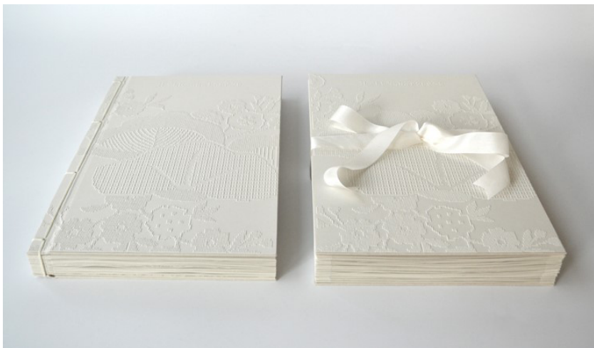
Marie-Ange Guilleminot. Le Livre-à-Porter , 2015. Collection Palais Galliera, Paris.Ouvrage en 2 volumes (l'un en accordéon, l'autre relié à la japonaise) avec l'aimable collaboration éditoriale d'Yves Jammet, conception graphique et éditoriale: E+K © reliure et photo Laurel Parker book ADAGP 2022