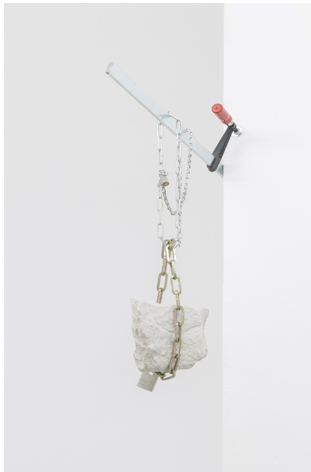
Éric Stephany La confiance , 2022 ADAGP 2022