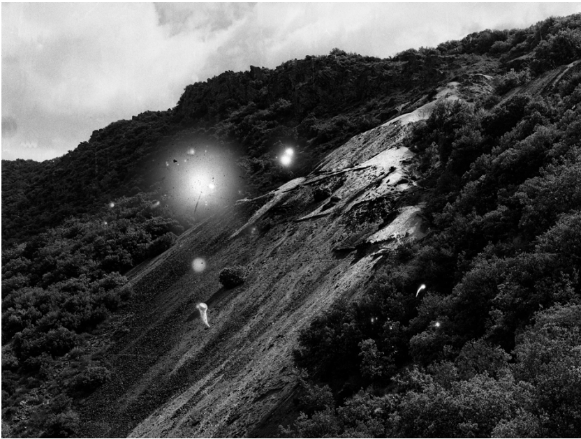
Coline Jourdan, Soulever la poussière (Résidence 1+2)