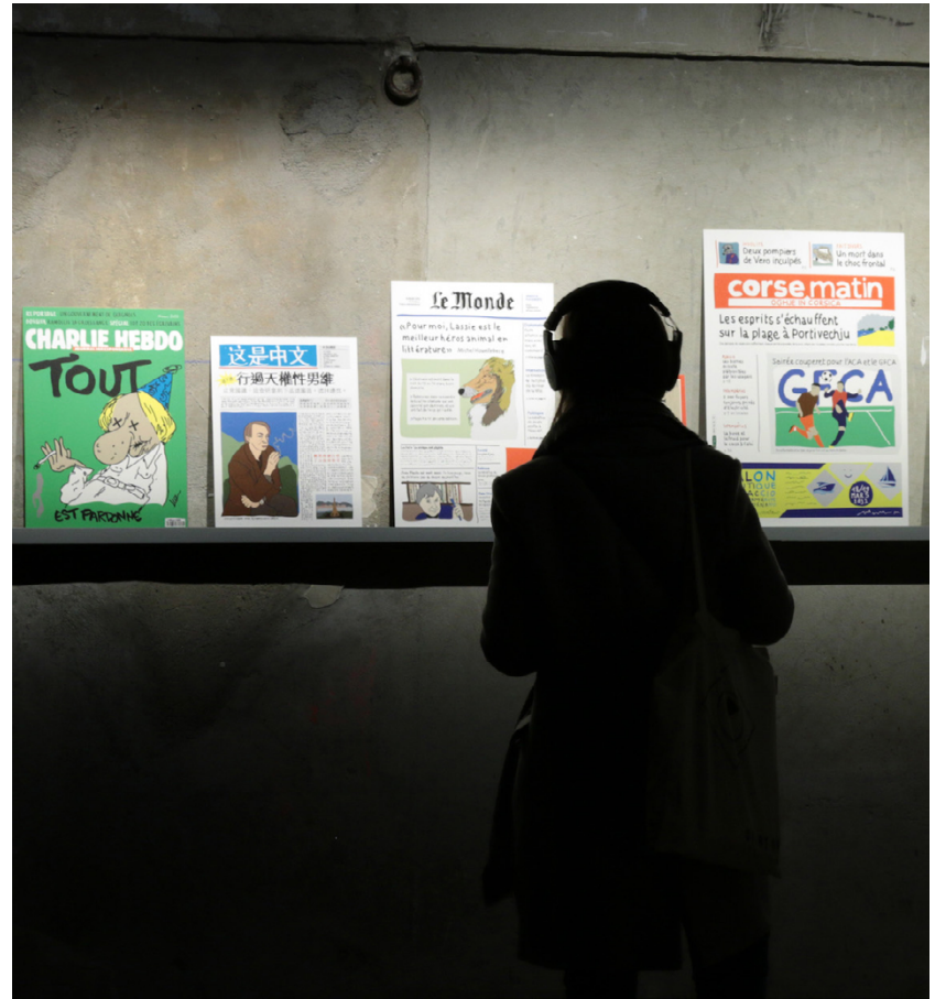
aalllicceelleessccaannnee&ssoonniiiaaddeerrzyppoolsskkii Mmmh [Maison-musée michel houellebecq] ADAGP 2022