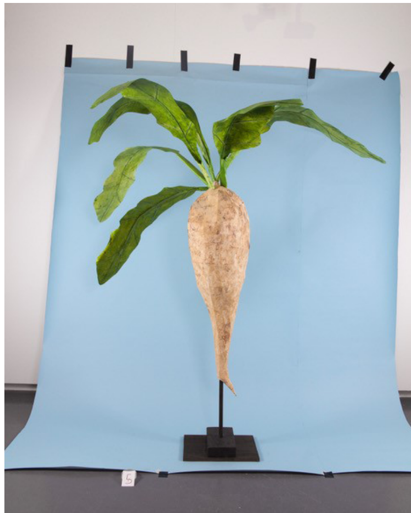
Grégoire Motte, Cichorium Intybus , Plant de chicorée à café ou chicorée sauvage