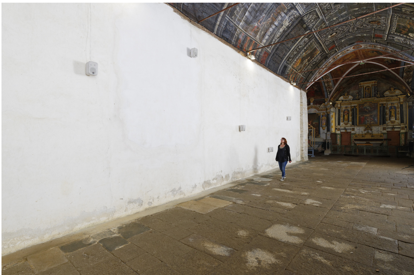
Dominique Petitgand, L'art dans les chapelles, 2021