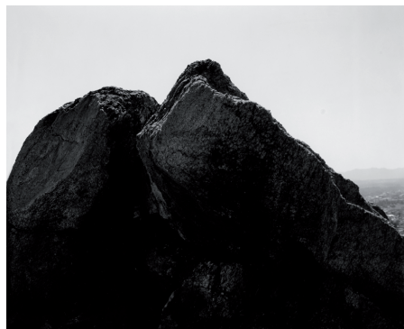
Robert Adams, La Loma Hills, California , 1984. Achat en 1989 Centre national des arts plastiques. FNAC 89594