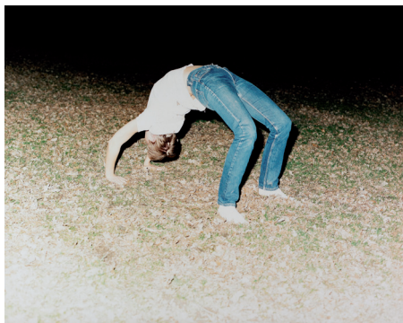
Annika von Hausswolff, State of Emergency with Blue Jeans , 1998 Achat en 1999. Centre national des arts plastiques. FNAC 99084