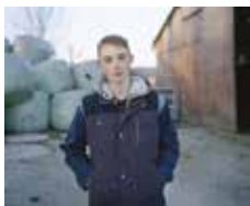
Marie-Noëlle Boutin Série : « Territoires de jeunesse » © Marie-Noëlle Boutin / Cnap