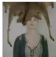
Alexandra Pouzet Bruno Almosnino Série : « Ça me regarde, janvier 2017, Quercy » © Alexandra Pouzet et Bruno Almosnino / Cnap