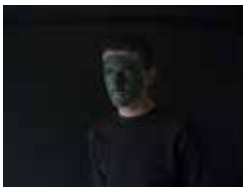
Claudine Doury Driss Mehdi, Paris. Série : « 1er Acte »