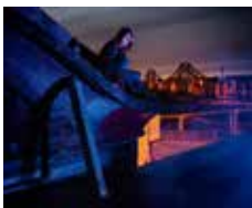
Guillaume Herbaut Série : « GEEKS 2 : Des supers héros en Picardie »