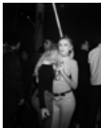
Pablo Baquedano Série : « Night-Clubs »

Les images sont utilisables et libres de droits pour la presse dans le seul cadre de la promotion des expositions et pendant la durée de celles-ci.