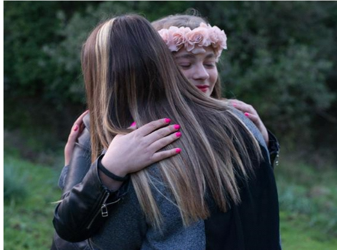
Lola Reboud Deux jeunes filles, Tamarone, janvier 2017. Série : « 80 km après la mer, 2017 ».

Exposition du 18 février jusqu'au 3 juin 2018 Friche la Belle de Mai (3e étage de la tour)