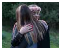
Lola Reboud Deux jeunes filles, Tamarone, janvier 2017. Série : « 80 km après la mer, 2017 » © Lola Reboud / Cnap