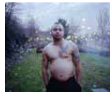
Myr Muratet ROM (1994) – Porte d'Aubervilliers, Paris 2017 Série : « CityWalk »