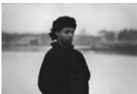
Gabrielle Duplantier Noellyne. Série : « Que deviennent les enfants d'ici ? »