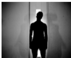
Klavdij Sluban Centre des Jeunes Détenus de Fleury-Mérogis. Série : « La jeunesse invisible » © Klavdij Sluban / Cnap