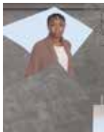
Chimène Denneulin Agnès - Port au Prince - 1993 / Université Montpellier 2016 Série : « 11 Rue de la Maison Blanche, 44100 Nantes »