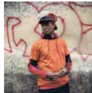
Yohanne Lamoulère Série : « Des histoires d'amour à Marseille – Le mythe de Gyptis et Protis » © Yohanne Lamoulère / Cnap