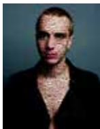
Gilles Coulon Extime # 7 – Maxim Série : « Extime »