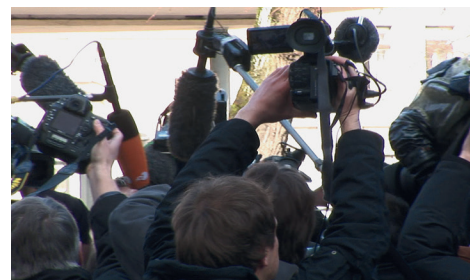
Marie Voignier, Hearing the Shape of a Drum , 2010, 17, FNAC 10-900, Collection Centre national des arts plastiques © Marie Voignier, Cnap, photo : Galerie Marcelle Alix, Paris