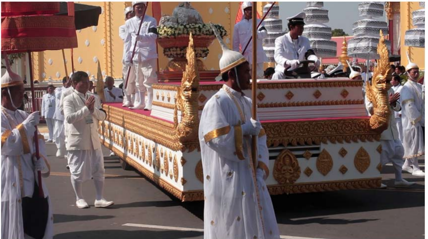
FOR MANY, FAREWELL IS ELUSIVE (Vidéo still)