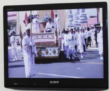
FOR MANY, FAREWELL IS ELUSIVE, Silver-prints 52x62, vidéo, Centre Photographique de Genève, © Olivier Menanteau / Galerie Anne Barrault