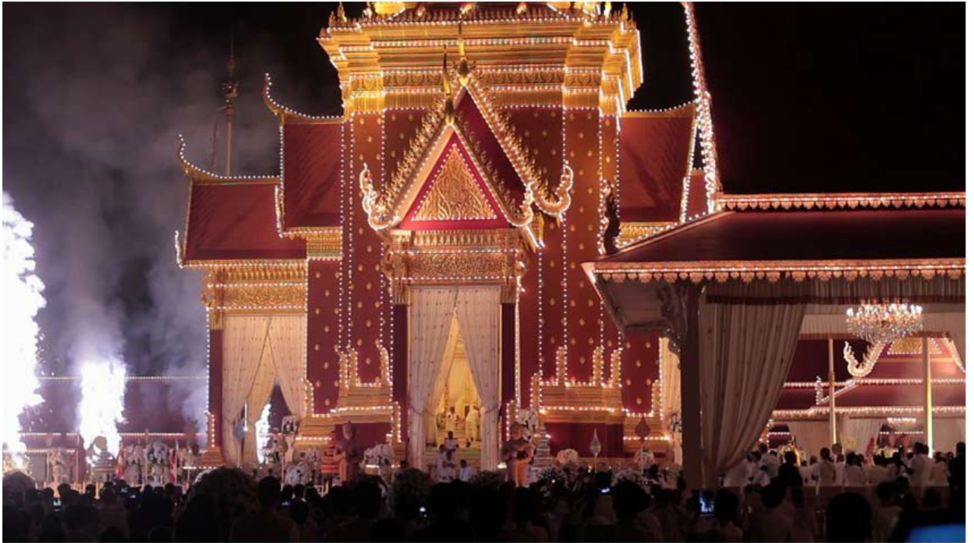
FOR MANY, FAREWELL IS ELUSIVE (Vidéo still)