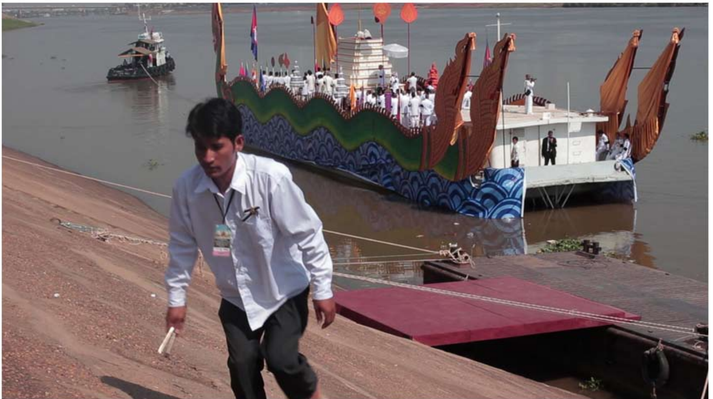
FOR MANY, FAREWELL IS ELUSIVE (Vidéo still)