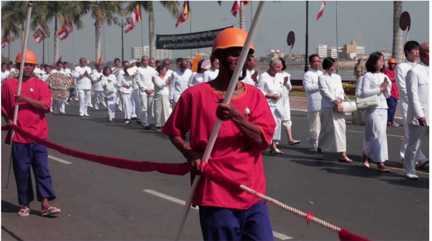
FOR MANY, FAREWELL IS ELUSIVE (Vidéo still)