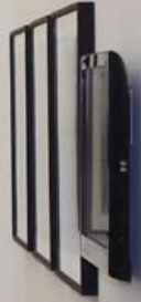
FOR MANY, FAREWELL IS ELUSIVE, Silver-prints 52x62, vidéo, Centre Photographique de Genève, © Olivier Menanteau / Galerie Anne Barrault