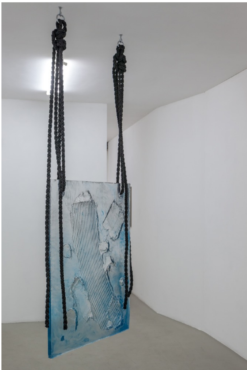
Ghost Painting (blue) , 2016 Résine polyester transparente, corde 122 x 90 cm