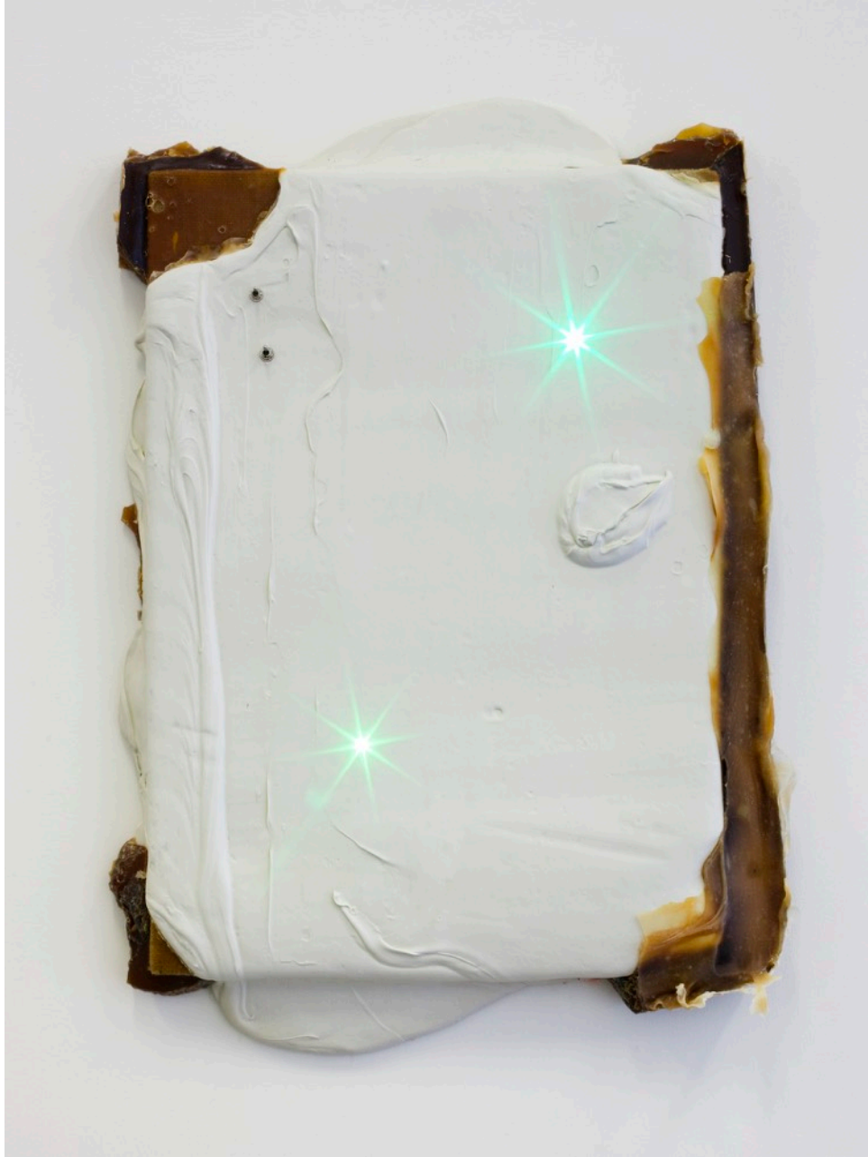
Overlight S5E9, 2017 Modelling paste sur toile de jute, latex, LED et interrupteurs, sur bois, 64 x 47cm