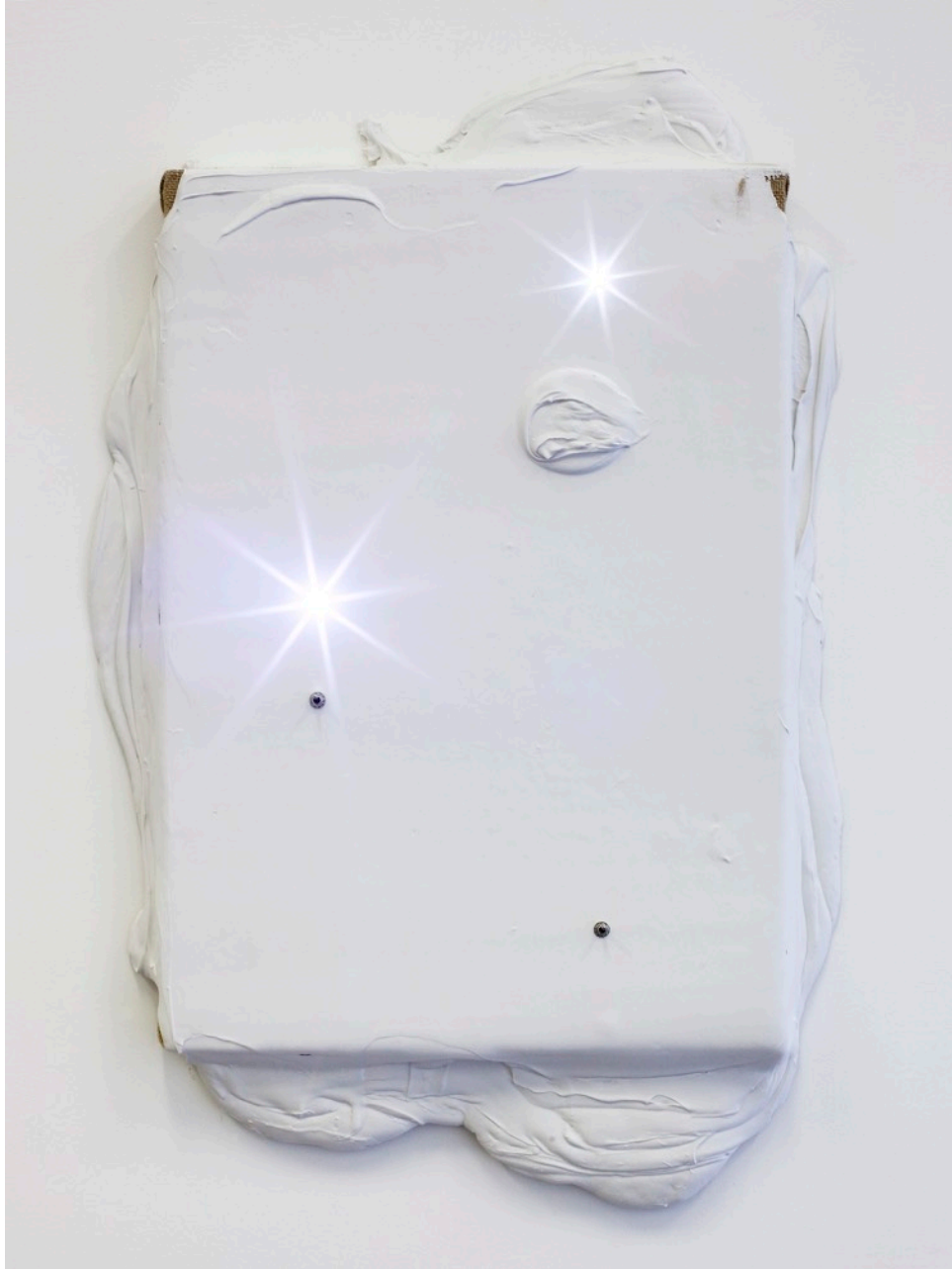
Overlight S5E7, 2017 Modelling paste sur toile de jute, LED et interrupteurs, sur bois, 64 x 47cm