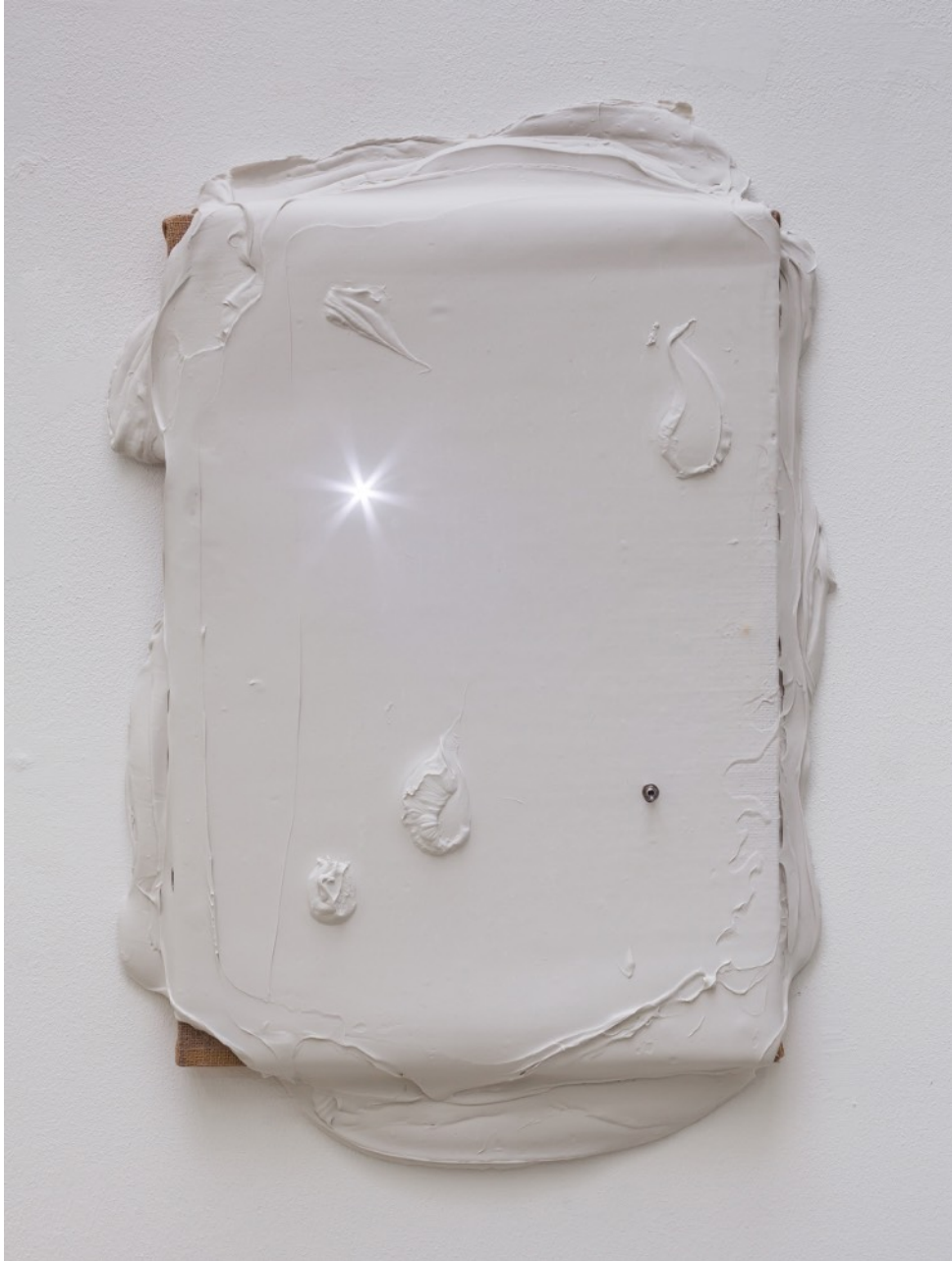
Overlight S4E1, 2016 Modelling paste sur toile de jute, LED et interrupteurs, sur bois, 80 x 52cm