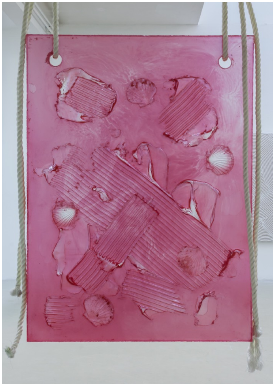
Ghost Painting (red) , 2016 Résine polyester transparente, corde 122 x 90 cm