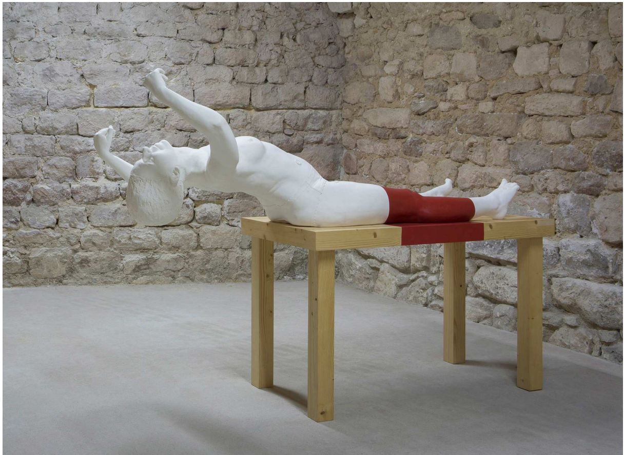
La vénus de la place Tahrir, rouge