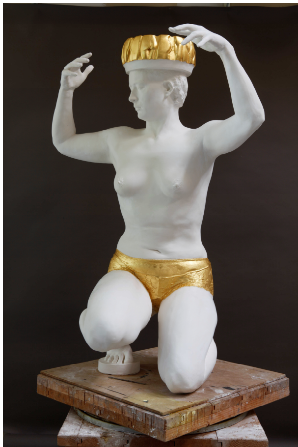
Leslie pense ses hanches, Collection MNAM de Paris