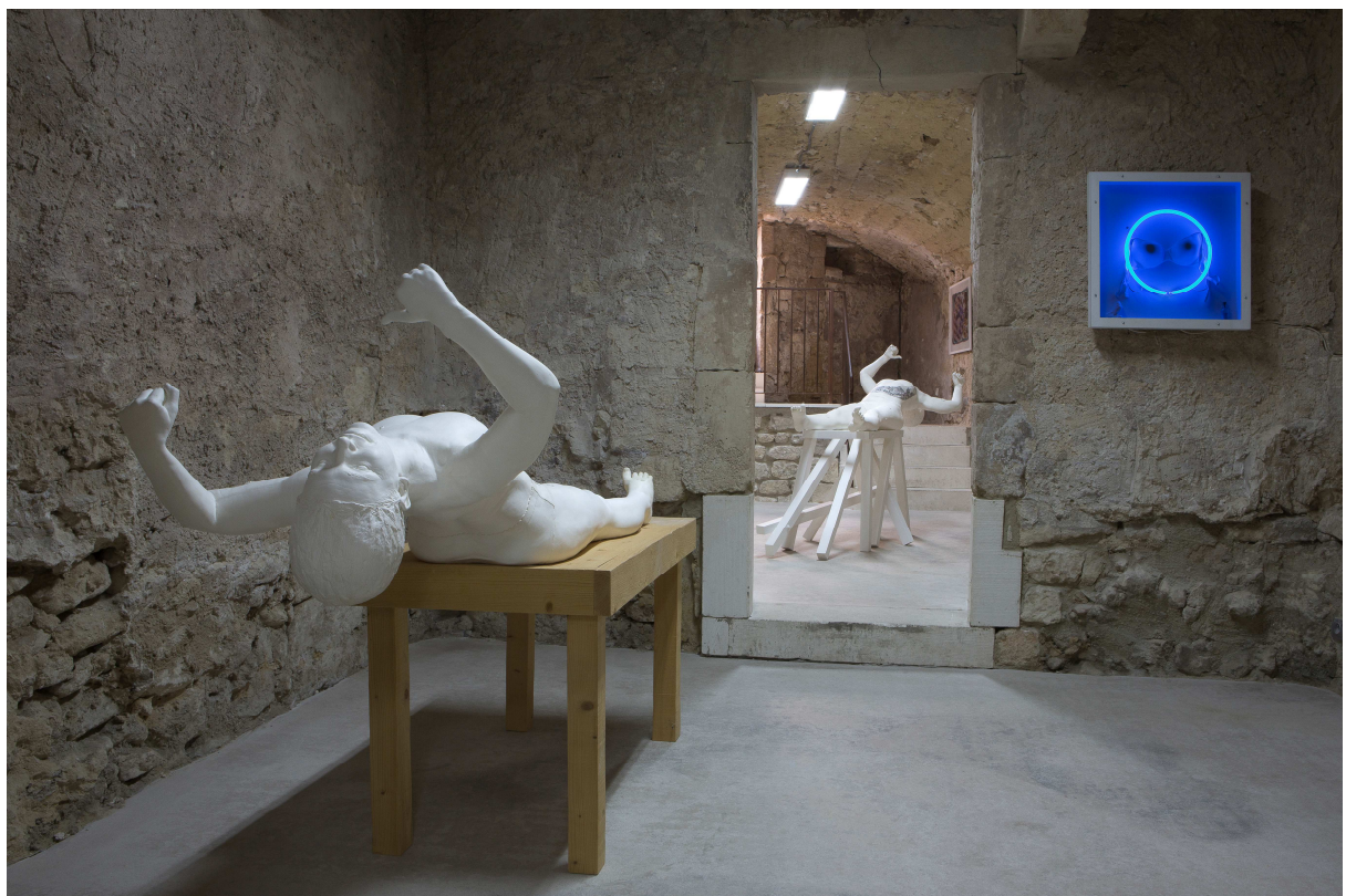
CAC de Saint Restitut