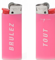
Claude Closky Brûlez tout , 1999, FNAC 03-157 © Claude Closky / Cnap, Crédit photo : Fabrice Lindor