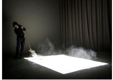
Edith Dekyndt One Thousand and One Nights , 2017 Nouvelle acquisition 2018 © Edith Dekyndt / Cnap, photographie DR