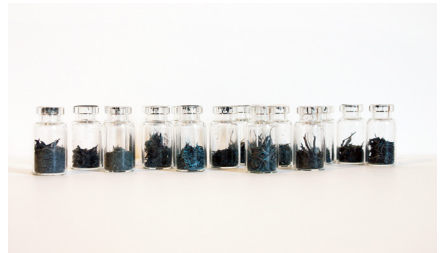
Estefanía Peñafiel Loaiza Sans titre (Figurants) , 2009 FNAC 10-105 © Estefanía Peñafiel Loaiza / Cnap photographie courtesy Galerie Alain Gutharc