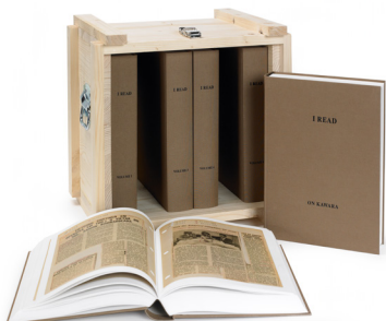
On Kawara I READ, 2017 FNAC 2018-0400 (1 à 7)