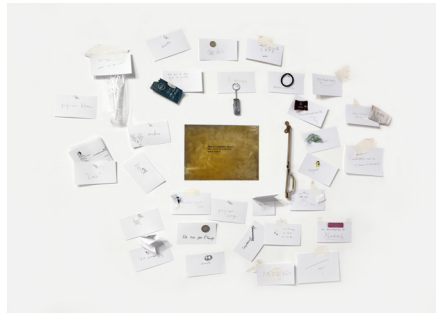
Luis Camnitzer Assignment#6 : Find an Unnamed Object and Suggest a Proper Name for it, 2011 FNAC 2014-0349