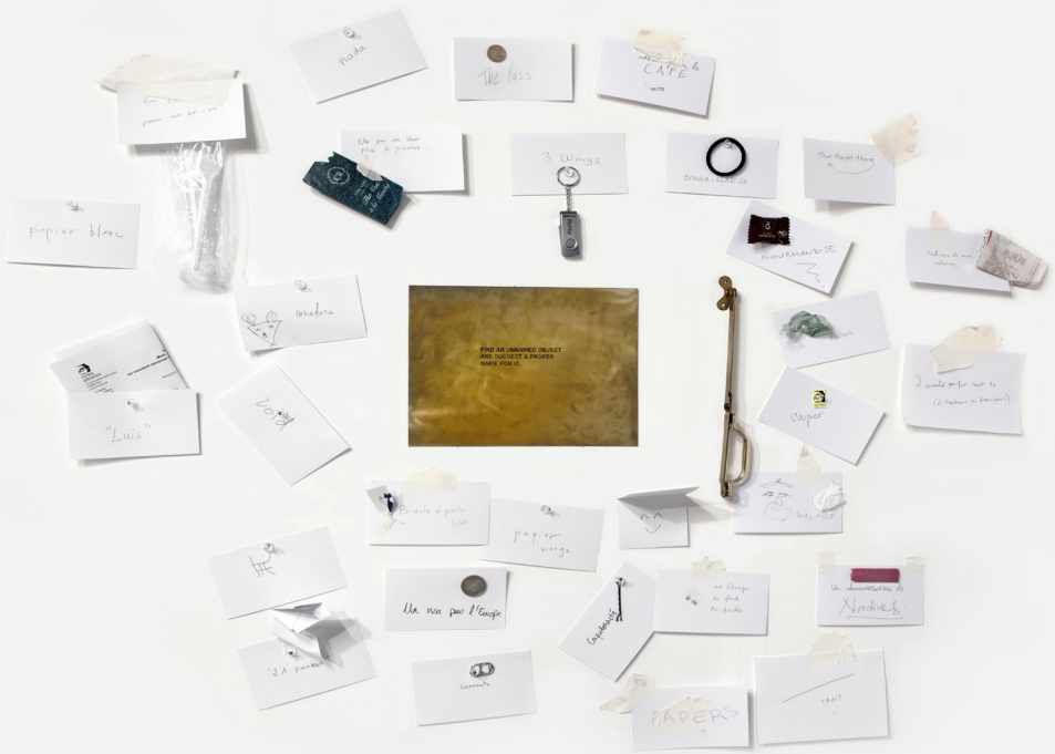
Luis Camnitzer, Assignment#6, 2011