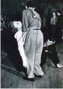
Émilie Pitoiset Tainted Love #4 , 2019 © Courtesy of the artist & Klemm's Gallery, Berlin