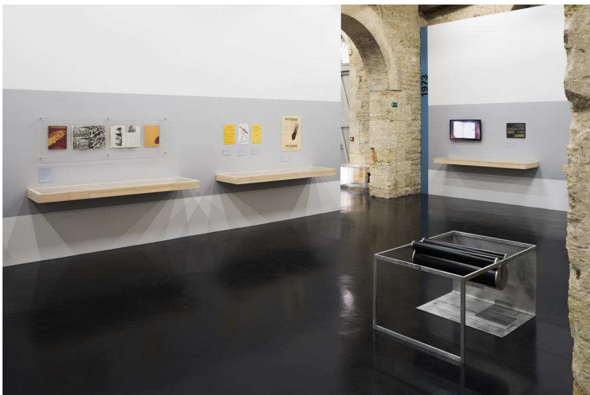
PHOTO 2 : Vue de l'exposition Beau Geste Press au CAPC musée d'art contemporain de Bordeaux, 2 février–28 mai 2017.