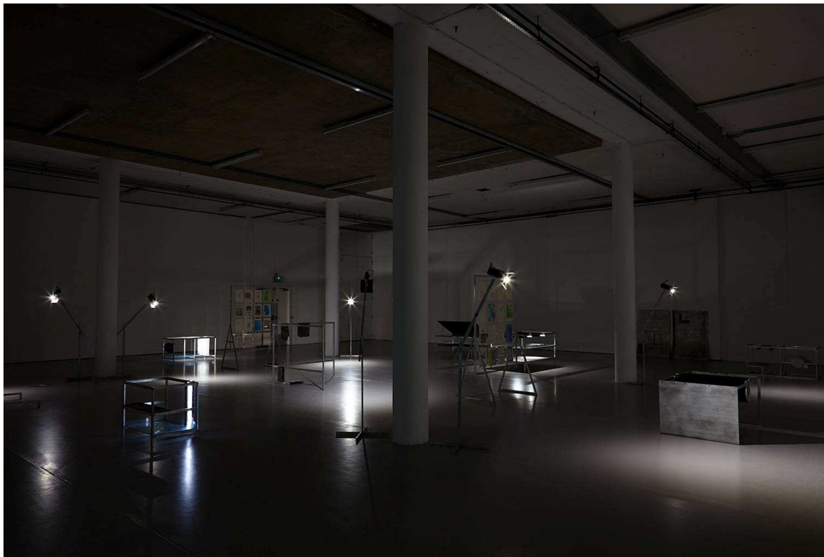
PHOTO 1 : Vue de l'exposition de Xavier Antin, The Eternal Network , Spike Island, 9 juillet–18 septembre 2016.