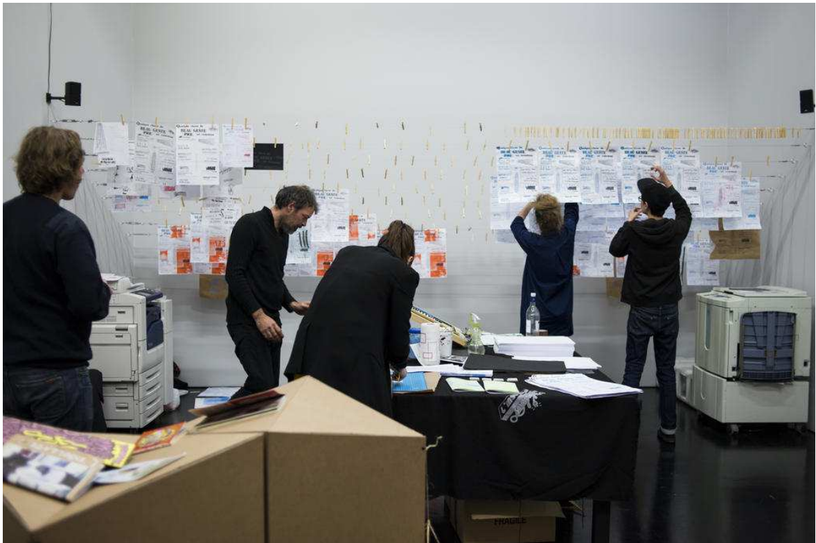
PHOTO 5 : Les membres de Disparate et de l'Insoleuse travaillant dans l'espace accueillant la programmation « Quelques chose de Beau Geste en commun » (avec aussi l'Atelier BULK, Our Fortress, les étudiants des séminaires « The Book Society » de l'EBABX Bordeaux et « Bibliomatrix » de l'EESI Angoulême & Poitiers), CAPC musée d'art contemporain de Bordeaux, février 2017.