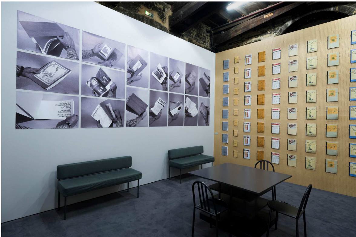
PHOTO 4 : Vue de l'espace ressources de l'exposition Beau Geste Press au CAPC musée d'art contemporain de Bordeaux, 2 février–28 mai 2017.